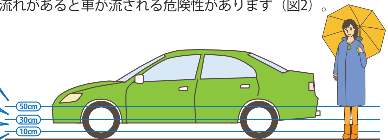
図2: 浸水深別の車の危険性について